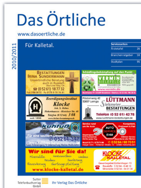
Das Örtliche für Kalletal, Ausgabe 2010/2011