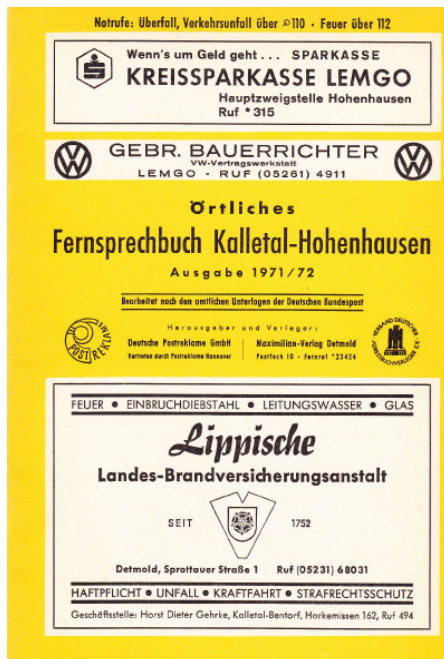
Örtliches Fernsprechbuch Kalletal-Hohenhausen, Ausgabe 1971/72