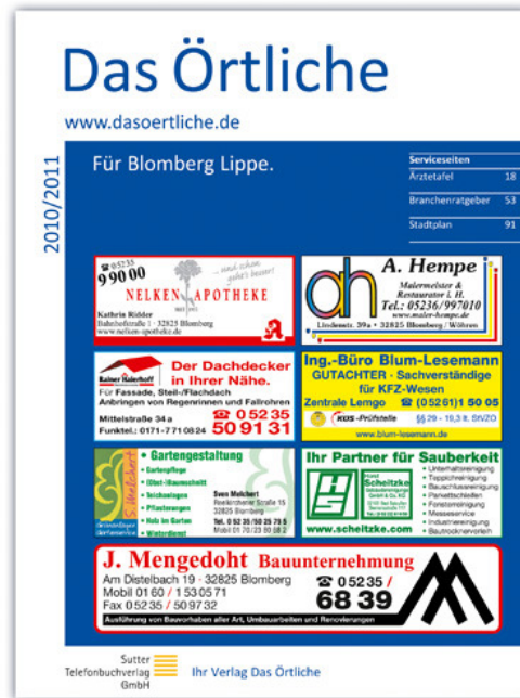
Das Örtliche für Blomberg Lippe, Ausgabe 2010/2011