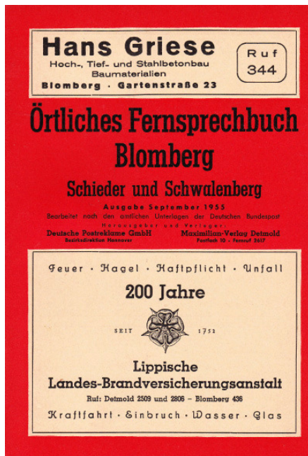
Örtliches Fernsprechbuch für Blomberg, Ausgabe 1955